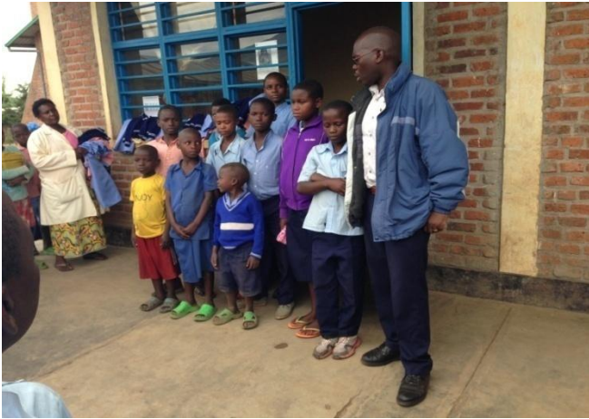
Les élèves sans uniforme