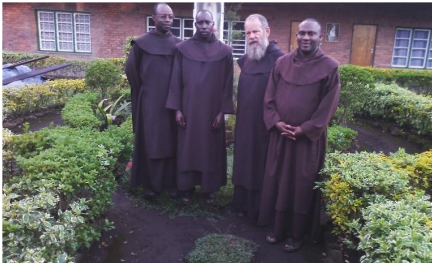
Pères Carmes Déchaux de la Paroisse Gahunga